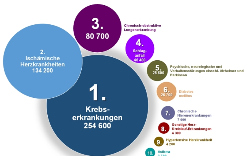
Abbildung 1: Die wichtigsten zehn nicht übertragbaren Krankheiten, die umweltbedingte Todesfälle verursachen

Ein Tätigwerden ist dringend geboten: Umweltverschmutzung kann Krebs, ischämische Herzkrankheiten, obstruktive Lungenerkrankungen, Schlaganfälle, psychische und neurologische Störungen, Diabetes und andere gesundheitliche Beeinträchtigungen verursachen 4 (siehe Abbildung 1). Trotz greifbarer Fortschritte war die Umweltverschmutzung 2015 immer noch die Ursache von schätzungsweise neun Millionen vorzeitigen Todesfällen weltweit (16 % aller Todesfälle) – dies ist das Dreifache der Todesfälle aufgrund von AIDS, Tuberkulose und Malaria zusammen und das Fünfzehnfache der durch Kriege und andere Formen von Gewalt verursachten Todesfälle. 5 In der EU ist jedes Jahr einer von acht Todesfällen auf Umweltverschmutzung zurückzuführen. 6